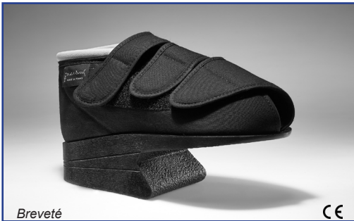
TYPE 1 - L.P.P. CHUT 2183855 Tarif de responsabilité 30,49 € TTC le pied